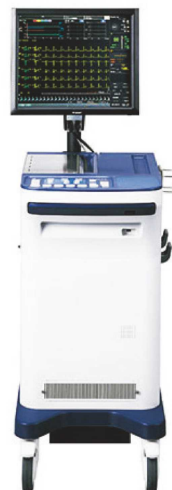
心肺運動負荷システム