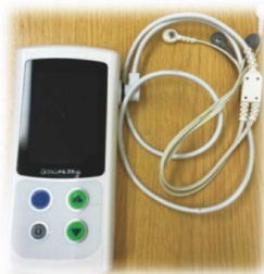
ジェントルスティム

様々な医療機器を使用してリハビリを行うこともあります。使用に関しては、医師の指示のもと、適切に行います。