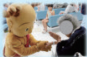
せんとかんも参加