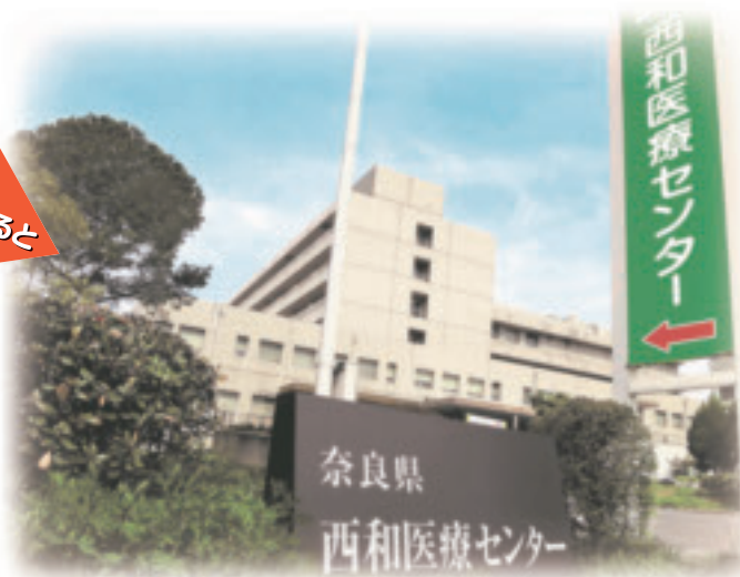
病院前道路からのview

「ファミリー」は年に4回の発刊を予定しています。地域の皆様の健康に役立ち、親しまれ愛される紙面作りをめざしていきます。