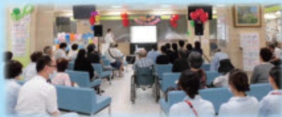
ふれあい祭 公開講座