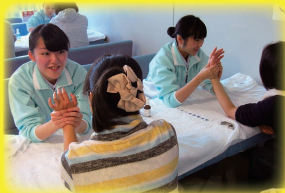
リラクゼーション リンパマッサージ体験 健康相談・健康チェック