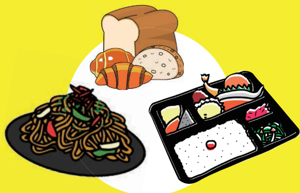
バザー 授産品販売