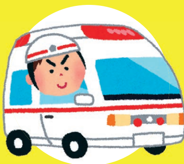
救急車見学・AED 実演