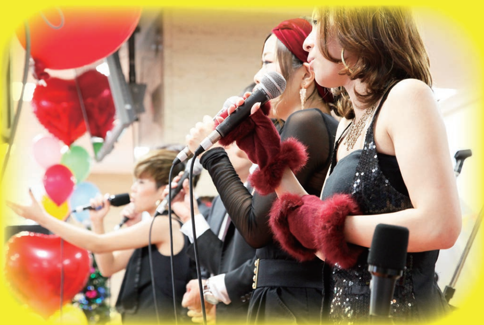
♪ ロビーコンサート・ミニコンサート ♪