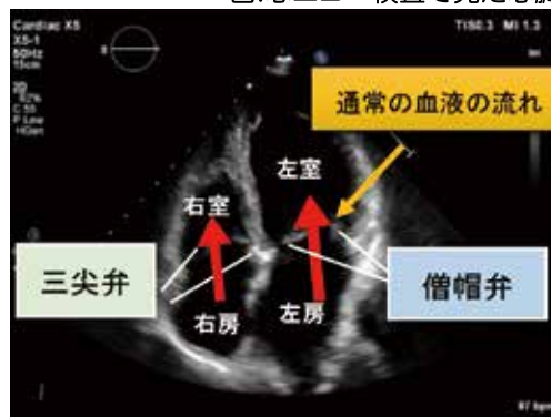
図.心エコー検査で見た心臓

心臓をリアルタイムで検査する方法として心エコー検査があります。超音波検査（エコー）とは、探触子（プローブ）という機器から人の耳には聞こえない高い音を組織に当て、跳ね返ってきた音をもとに画像化する検査です。この検査は、体への負担が少なく繰り返し行うことが可能です。心エコー検査では、各部屋の厚さ大きさを計測し、動き・構造・状態を観察しています。検査時間は約15～30分程度かかります。