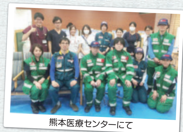
熊本医療センターにて