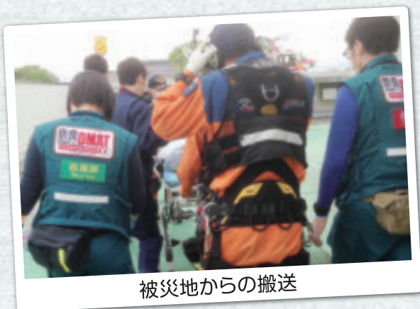
被災地からの搬送