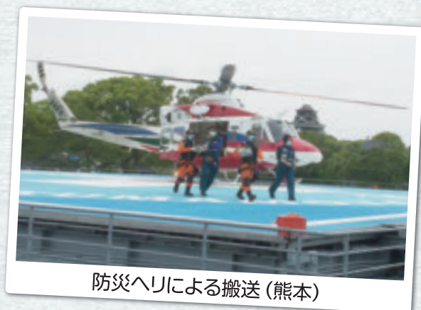
防災ヘリによる搬送 (熊本)