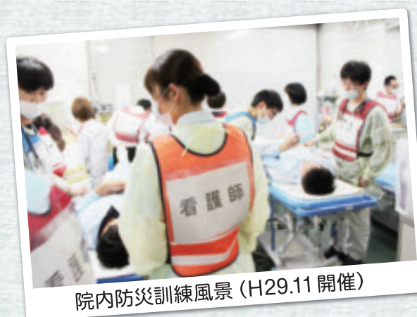
院内防災訓練風景 (H29.11 開催)